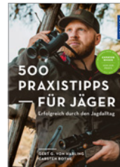
von Harling/Bothe 500 Praxistipps für Jäger 192 S., 250 Abb., brosch. € 22,-