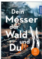
Thomas Rall Dein Messer, der Wald und Du 176 S., 250 Abb., brosch. € 18,-