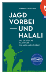
Johannes Dietlein Jagd vorbei und Halali 304 S., ca. 25 Abb., geb. € 28,-