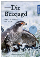
Elisabeth Leis (Hrsg.) Die Beizjagd 208 S., 205 Abb., geb. € 32,-