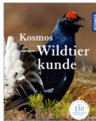
Ekkehard Ophoven Kosmos Wildtierkunde 192 S., 240 Abb., brosch. € 22,-