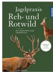
Kurt Menzel Jagdpraxis Reh- und Rotwild 336 S., 194 Abb., geb. € 26,-