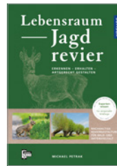
Michael Petrak Lebensraum Jagdrevier 240 S., 200 Abb., geb. € 39,-