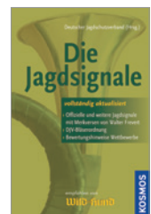
Deut. Jagdschutzverband Die Jagdsignale 48 S., brosch. € 8,-