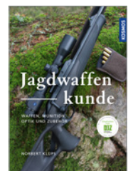
Norbert Klups Jagdwaffenkunde 144 S., 150 Abb., geb. € 30,-