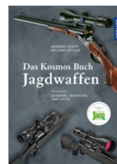
Klups/Zeitler Das Kosmos Buch Jagdwaffen 272 S., 396 Abb., geb. € 39,90