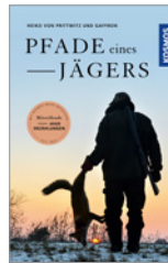
Heiko von Prittwitz und Gaffon Pfade eines Jägers 224 S., geb. € 25,-