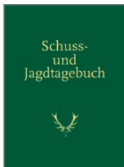
Schuss- und Jagdtagebuch 128 S., 32 Abb., geb. € 18,-