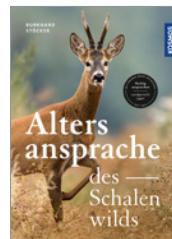
Burkhard Stöcker Die Altersansprache des Schalenwilds 160 S., 190 Abb., geb. € 28,-