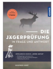
Siegfried Seibt Die Jägerprüfung in Frage und Antwort 280 S., broschiert € 30,-