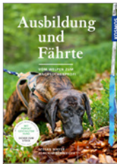
Mayer/Schweizer Ausbildung und Fährte 160 S., 130 Abb., geb. € 25,-