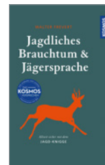
Walter Frevert Jagdliches Brauchtum und Jägersprache 284 S., 62 Abb., geb. € 20,-