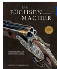
Christoph Tavernaro (Hrsg.) Büchsenmacher 208 S., 200 Abb., geb. € 50,-