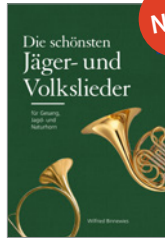
Wilfried Binnewies Die schönsten Jäger- und Volkslieder 152 S., brosch. € 15,-