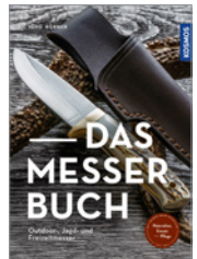
Jörg Hübner Das Messerbuch 144 S., 200 Abb., brosch. € 25,-