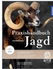
Bachmann/Roosen Praxishandbuch Jagd 656 S., 1.021 Abb., geb. € 68,-