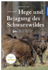
Norbert Happ Hege und Bejagung des Schwarzwildes 224 S., 179 Abb., geb. € 32,-