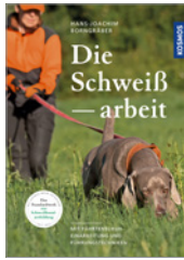
Hans-Joachim Borngräber Die Schweißarbeit 336 S., 368 Abb., geb. € 50,-