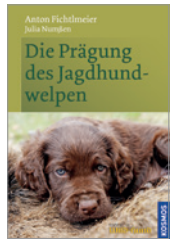
Fichtlmeier/Numßen Die Prägung des Jagdhundwelpen 128 S., ca. 100 Abb., geb. € 24,-