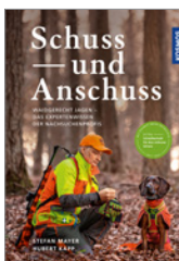
Kapp/Mayer Schuss und Anschuss 176 S., 238 Abb., geb. € 32,-