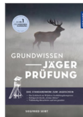
Siegfried Seibt Grundwissen Jägerprüfung 608 S., 857 Abb., geb. € 34,-