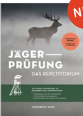
Siegfried Seibt Jägerprüfung - das Repetitorium 160 S., 50 Abb., brosch. € 22,-