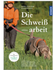
Hans-Joachim Borngräber Die Schweißarbeit 336 S., 368 Abb., geb. € 50,-