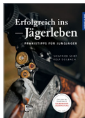
Seibt/Deilbach Erfolgreich ins Jägerleben 144 S., 141 Abb., geb. € 24,99