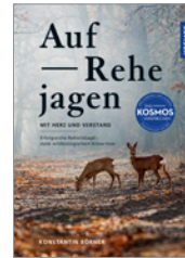
Dr. Konstantin Börner Auf Rehe jagen 160 S., 162 Abb., geb. € 28,-