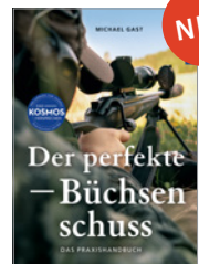
Michael Gast Der perfekte Büchsen schuss 160 S., 110 Abb., geb. € 28,-