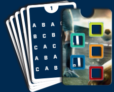
1 Decoder + 5 Lösungskarten

50 Frage-Karten sortiert ihr nun die 10 Karten aus, die etwas anders aussehen (→ Echt jetzt?! ). Stapelt sie so, dass die Frageseite jeweils nach oben zeigt, mischt sie und legt sie unterhalb des Spielplans ab. 7) Dann mischt ihr die restlichen 40 Frage-Karten und legt sie oberhalb des Spielplans ab.