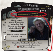
Krätze & Peter Pettigrew