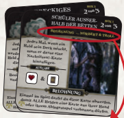
Norbert & Troll